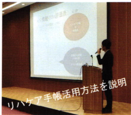
リハケア手帳活用方法を説明